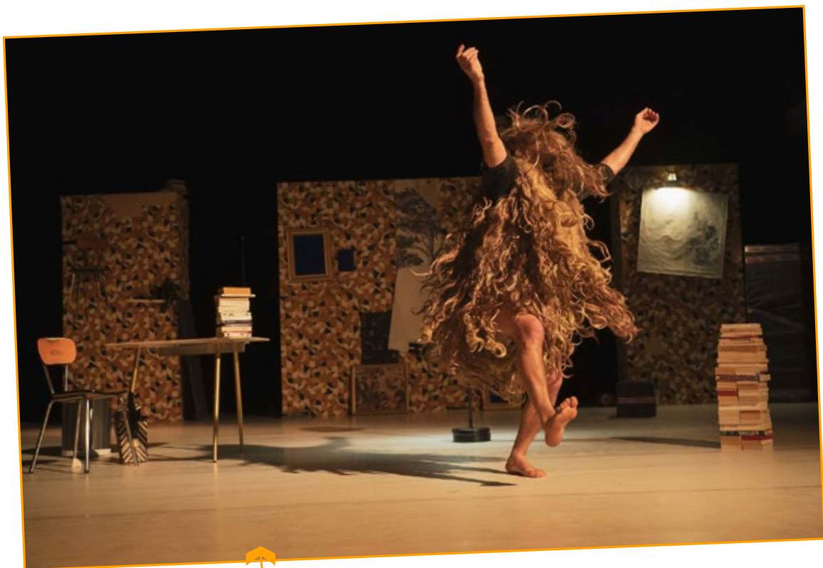
Photo du spectacle Valse avec Wrondistilblegretralborilatausgavesosnoselchessou