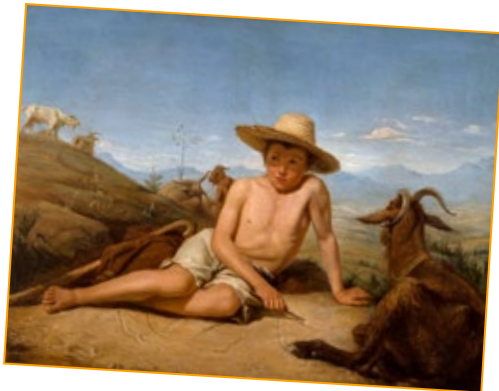
Giotto gardant les chèvres Léon BONNAT, 1850 Bayonne, musée Bonnat-Helleu