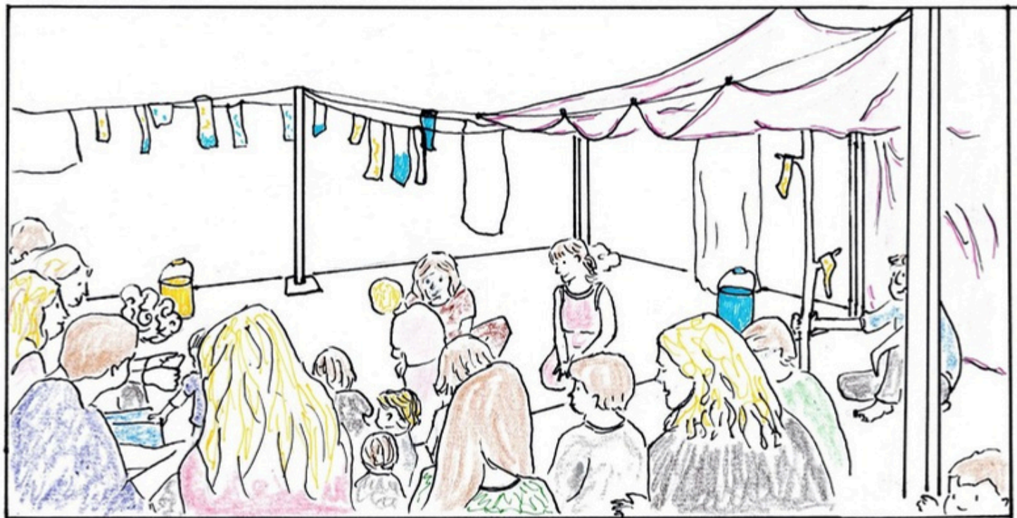
Croquis sortie de résidence à Eugénie-les-bains, Septembre 2025